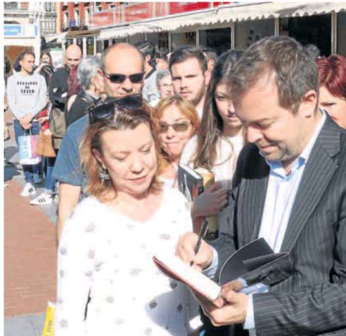
Javier Sierra firma ejemplares de sus obras en la Plaza Mayor, donde se formó una gran cola.

Pese al éxito, Sierra vive con la defensa de su estilo ya preparada: «No son incompatibles lo literario y lo pedagógico», declaró ayer momentos antes de su acto de presentación en la Feria del Libro de Valladolid: «lo separamos con los Modernismos, cuando se empezó a apostar por la forma y no por el fondo y explorá-